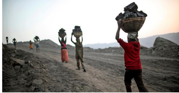
Mining perils: Labourers carry baskets of coal from an open-cast mine in Jharkhand.

According to the Ministry of Coal, illegal